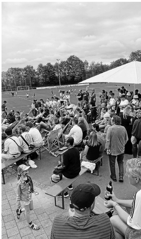
WM-Vorfreude im Sportpark Himmerreich – SKG Botnang lädt 2026 wieder zum Public Viewing

N ach der großartigen Stimmung zur EM 2024 ist klar: Botnang kann große Fußballfeste! Deshalb freut sich die SKG Botnang schon jetzt, im Juni 2026 erneut ein großes WM-Public-Viewing im Sportpark Himmerreich ankündigen zu können.